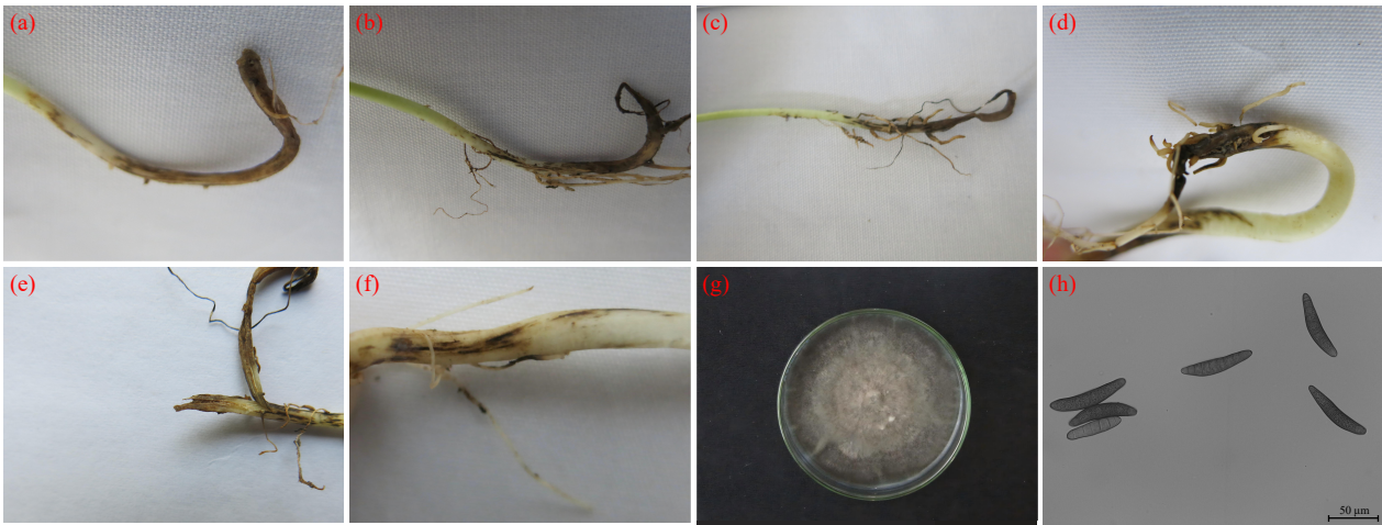
(a)~(d): 根部; (e): 根部剖面; (f): 根部细节; (g): 菌落; (h): 分生孢子 (40×)。 (a)-(d): root; (e): root cross-section; (f): root detail; (g): colony; (h): spore (40×).