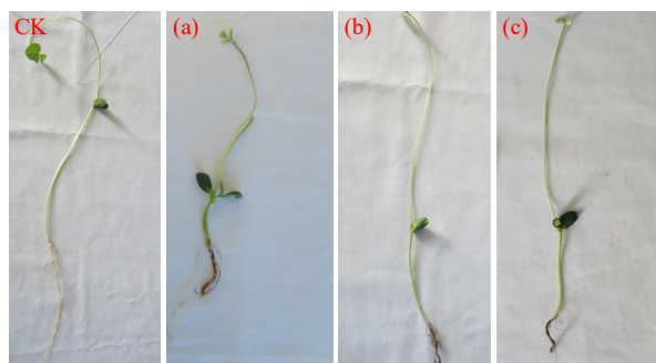
CK: 对照植株; (a) 新月弯孢根腐病植株; (b) 玉蜀黍平脐蠕孢根腐病植株; (c) 大斑突脐蠕孢菌根腐病植株。

CK: control plant; (a) C. lunata root rot plant; (b) B. maydis root rot plant; (c) E. turcicum root rot plant.