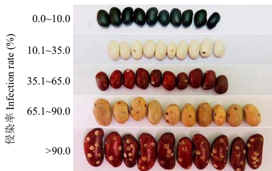
图 2 不同抗性级别菜豆资源受菜豆象侵染情况

普通菜豆资源不同受害率表现如图 2 所示，在鉴定的 473 份菜豆资源中，其抗性水平存在较大差距（图 3），抗菜豆象资源共计 232 份，占鉴定总数的 49.1%，感菜豆象资源共计 241 份，占 51.0%。在抗性资源中，高抗资源有 15 份，占鉴定总数的 3.2%；F1432、F0645、F0675、F0004351