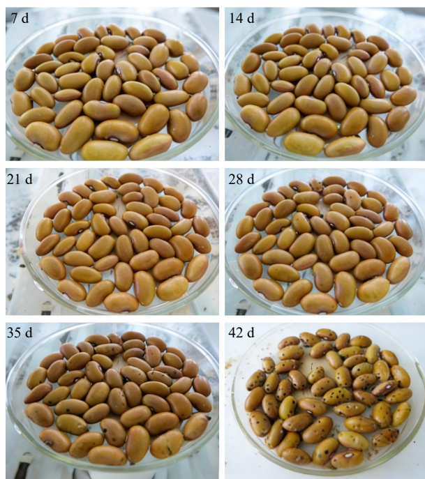
图 1 菜豆象侵染过程

化蛹；随着时间的推移，蛀食孔逐渐增多，35 d 后，蛀食孔较之前明显增多；42 d 后，菜豆象已大量化蛹，为害严重的菜豆上蛀食孔超过 10 余个（图 1）。试验前期、中期和后期菜豆象侵染进程符合预期，与申智慧等 [1] 发现的菜豆象发生规律一致。