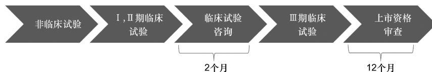
图1 日本一般情况的药品上市流程

2.2 具体措施 获得先进药物认定资格的药物可以在上市前后得到不同的政策支持。在药物上市审评审批过程中,先进药物认定系统通过优先咨询、充分的预评估、优先审查和礼宾服务等举措加速药物上市进程(见图1和图2);在上市后,先进药物认定系统则通过大量的上市后措施和给予药品定价一定的溢价空间继续对产品给予优待,这些措施共同构成了先进药物认定系统。