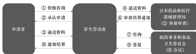
图 3 日本先进药物认定资格认定程序