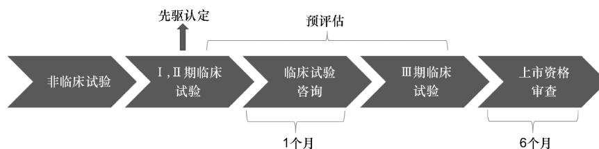
图2 日本获得先进药物认定资格的药品上市流程

先进药物认定系统的具体措施如下:首先是优先咨询,符合先进药物认定标准的药物将获得优先咨询的资格。通过优先咨询,药物上市的申请人可以获得关于临床试验开展的建议,同时临床试验减少从提交材料开始的临床试验咨询的等待时间,这段时间会由通常的2个月减少到1个月;其次是充分的预评估,主要包括药物质量、临床资料、非临床资料、《药品非临床研究质量管理规范》(GLP)及