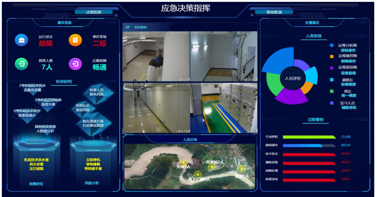
图2 水电站应急指挥可视化技术应用效果