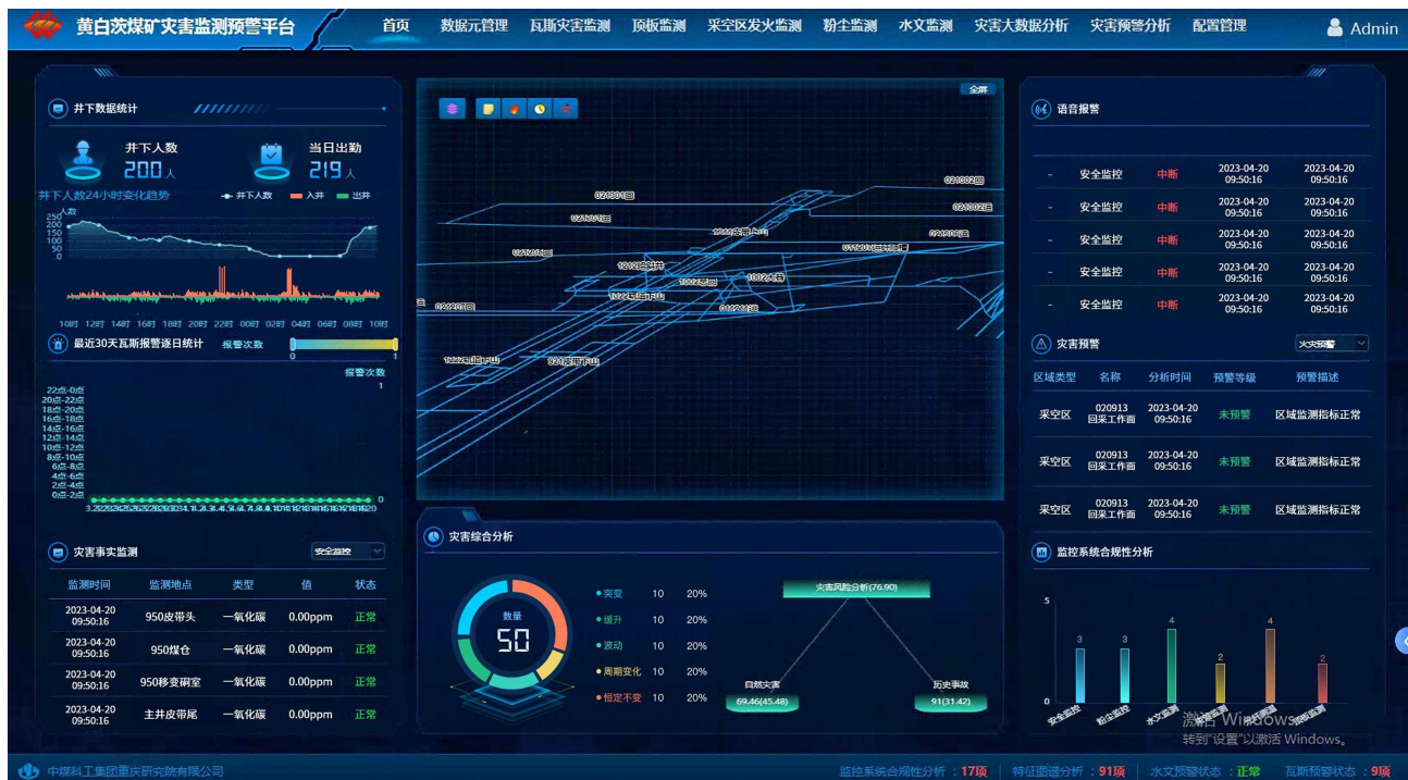
图4 灾害监测预警平台门户首页