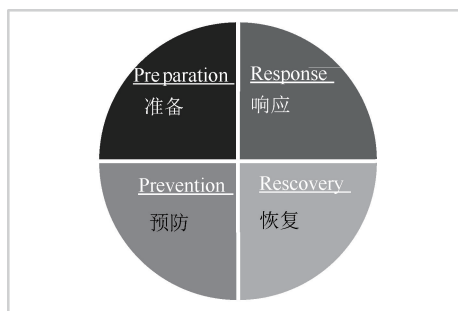
图 1 应急过程 PPRR 模型

预防、准备、响应、恢复 4 阶段 (Prevention-Preparation-Response-Recovery, PPRR) 模型 [16] 是美国联邦安委会提出的一种综合的应急管理模型,得到国际上的普遍认可,被视为全球应急管理实践的基础,是当前应急领域广泛应用的代表性理论。该模型按照突发事件的发生、发展规律,主张从突发事件全生命周期的 4 个阶段展开工作,即事前的预防 (Prevention)、事前的准备 (Preparation)、事中的响应 (Response) 以及事后的恢复 (Recovery)。这 4 个阶段形成一个闭合的循环过程,如图 1 所示。