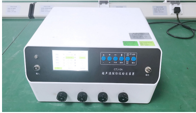
图 2 CTJ-5A 型超声探伤仪检定装置