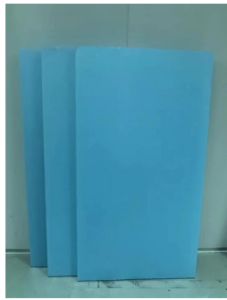
图2 挤塑聚苯乙烯发泡板 Fig.2 Extruded polystyrene foam board