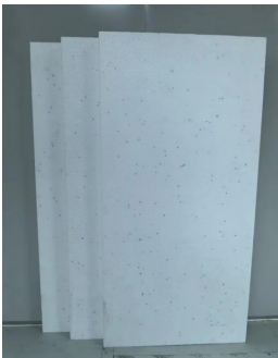
图1 模塑聚苯乙烯发泡板 Fig.1 Molded polystyrene foam board

建筑材料中的高效隔热材料,其热传导系数小于等于 0.12 \text{ W}/(\text{m}\cdot\text{K}) ,对于节能减排在工程建筑中的贡献不容忽视。其中,一种常见的环保型隔热材料是聚苯乙烯泡沫板(或称XPS板和EPS板,见图1~2),其构造独特,由经过特殊工艺处理的聚苯乙烯颗粒构成,首先将这些颗粒加热熔融,随后注入模具中迅速冷却固化 [3] 。聚苯乙烯泡沫板不仅具备卓越的保温性能,导热系数一般小于 0.039 \text{ W}/(\text{m}\cdot\text{K}) ,还兼有隔绝噪声的特点,其特性稳定,即使在低温环境中仍能维持原有功能,耐温范围通常低于 70^\circ\text{C} ,具备吸水率低,且不易引燃的特点,施工过程简便 [4] 。此外,它成本效益高,生产和维护简单,且具备良好的可回收性,有利于循环经济。