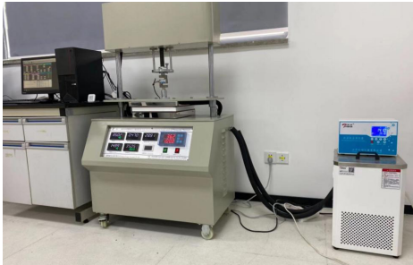
图 4 DRH-III 型导热系数测定仪 Fig.4 DRH-III thermal conductivity tester

规格及品质等级是否符合检测需求, 确保其适用性。接着, 实施统一的样本追踪系统, 每份样本都应附上独特的标识标签, 明确其处理状态, 确保信息清晰, 避免混淆。在样本的流通环节中, 务必保持标识的稳定性, 不得随意变更; 接收样本后, 应将其有序地存放在专用区域, 按类别整理, 确保其在整个实验过程中的安全, 防止因意外而受损或遗失。在整个操作过程中, 样本和标识的保护至关重要, 任何非检测操作都可能导致它们的损坏 [9] 。