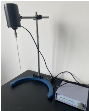
图2 电动搅拌器 Fig.2 Electric Blender