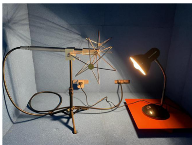
图 1 天线水平扫频

台灯测试：在测试过程中，按照 EN55015RE3m 标准进行操作，使用双锥天线在 30 MHz 至 1000 MHz 的频率范围内进行扫频。如图 1 所示分别为天线水平扫频。结果显示(如图 2 所示)，台灯在正常点亮的状态下产生了不同程度的辐射干扰，峰值超过限值。通过调整铁氧体材料的优化配置，以及调整天线与设备的距离，显著减少了辐射强度，使得测试结果满足 EMC (电磁兼容性) 要求，如图 3 所示。