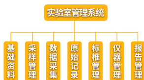
图2 实验室信息管理系统