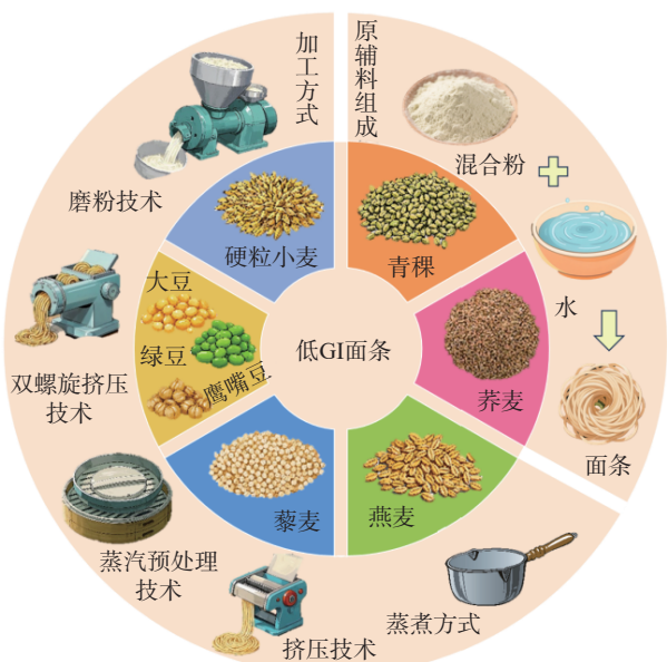
图 1 低 GI 面条的原辅料组成和加工方式示意图

在青稞面条加工方式方面,通过调节面条的酸碱环境也能控制淀粉酶的活性,调控面条消化特性。