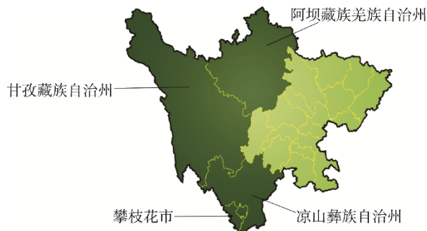
图 2 四川省主要产地 Fig.2 Main origins in Sichuan Province

中, 年均气温 10.7 °C, 降雨量年均均为 797.2 mm, 收获期在 7 月中旬至 10 月上旬。