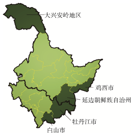
图 4 东北地区主要产地 Fig.4 Main origins in the Northeast

长白山区的白山市和延边朝鲜族自治州是吉林省松茸的主产区,其中安图县、图们市、珲春市和龙井市是延边地区松茸的主要小产区(图 4)。吉林共有两个松茸自然保护区,分别为珲春松茸省级自然保护区(1317.21 km 2 ),