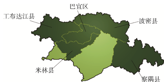
图 1 西藏林芝地区主要产地 Fig.1 Main origins in Linzhi, Tibet

江达、百巴、鲁朗、波密、米林的新鲜松茸子实体所含营养成分进行了测定, 发现松茸子实体中粗蛋白含量为 9.06%~14.46%, 工布江达和米林松茸较高; 粗脂肪含量在 5.47%~8.42%, 其中工布江达松茸含量最低, 为 5.47%; 粗多糖含量为 8.97%~10.01%, 林芝百巴松茸为最高; 氨基酸含量为 5.69%~12.23%, 米林松茸最高。熊伟等 [53] 采用水提醇沉法提取西藏 TMP, 获得最佳工艺条件如下: 料液比为 1:10、提取温度为 80 °C、醇析浓度为 85%提 4 h 后, 粗多糖得率为 8.98%。