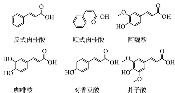
图 1 肉桂酸和常见羟基肉桂酸化学式

羟基肉桂酸是一大类以肉桂酸为基本化学结构的天然酚类化合物 [1] ,是植物中最常见、分布最广泛的酚酸,起源于肉桂酸与奎宁酸或 3,4-二羟基苯二酸的羟基化、甲基化或酯化反应,也可以以衍生形式存在 [2] ,例如酰胺(与氨基酸或肽结合)和酯(与羟基酸或糖苷结合)。常见的羟基肉桂酸有阿魏酸、对香豆酸、芥子酸、咖啡酸、绿原酸、迷迭香酸 [3] ,其中阿魏酸(4'-羟基-3'-甲氧基肉桂酸)、芥子酸(3',5'-二甲氧基-4'-羟基肉桂酸)、对香豆酸(4'-羟基肉桂酸)、咖啡酸(3',4'-二羟基肉桂酸)是羟基肉桂酸的典型代表。羟基肉桂酸可从茶树、可可、肉桂、水果(皮)、蔬菜、玉米等原料中获得 [4] ,其具有简单的碳骨架 C 6 -C 3 化学结构,它的结构特征在于存在连接苯环和羧基的乙烯键,以及存在一个或多个羟基,其氢可以被甲基自由基取代 [5] 。肉桂酸和常见羟基肉桂酸化学式,见图 1 [6] 。