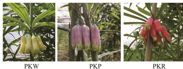
图 1 3 个品系滇黄精的花色类型

3 个不同品系滇黄精材料采自云南省玉溪市滇黄精种植基地,为 3 年生根茎,不同品系的特征性状分别为白色花绿色茎(PKW)、紫色花绿色茎(PKP)、红色花紫色茎(PKR)(图 1)。根茎带回后洗净,部分鲜样用于测定水分含量,其余样品切片后于 60 °C 烘箱中烘干至恒重,磨粉,过 50 目筛后,用于测定其他品质指标。