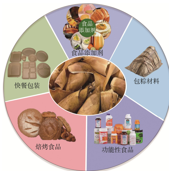
图 2 竹笋壳在食品中的应用

如图 2 所示, 竹笋壳可以直接作为包装材料, 用于普洱茶、粽子等包装; 也可以从中提取纤维素等物质作为包装材料的基材。如周小婉 [51] 采用自主研发的新型竹纳米纤维素/聚乙烯醇复合气凝胶保温箱对脆李、冬枣、荔枝和草莓进行包装, 在模拟电商物流 48 h 后, 复合气凝胶保温箱