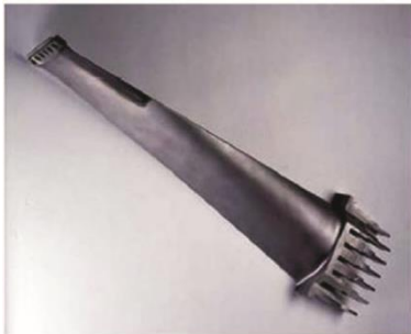
图6 前边沿经过激光硬化的 33.5" L-0 叶片 Fig.6 The 33.5" L-0 blade with laser-hardened leading edge

叶片是汽轮机中重要部件之一，图6为前边沿经过激光硬化的L-0级叶片照片 [3] 。在机组运行时，由于高温段叶片的服役工况极其恶劣（受高温高压蒸汽的直接冲击），可能发生氧化、冲蚀、疲劳损伤，因此，需要具备良好的抗蒸汽氧化、抗腐蚀冲蚀和抗疲劳能力。紧固件在高温下则可能发生疲劳损伤，要求具有高的强度和良好的高温应力松弛性能与抗蠕变性能。