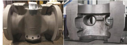
a) Haynes282 阀体 b) Alloy625 高压缸铸件

Alloy625；日本阀门（阀体）推荐Alloy625，汽缸和阀壳推荐改型Alloy617和Alloy625；中国阀门推荐国产HT700Q(GH2070Q)、C-HRA-1和国外Alloy625、改型Alloy617，缸体与阀壳推荐HT700Q、Alloy625。