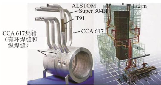
图 3 锅炉焊接集箱及接管实体模型和主蒸汽管道布局 Fig.3 The solid model of boiler welded header and structural diagram of main steam pipeline

经过对多种候选材料进行性能测试和评估后，国内外 700 °C 技术机组汽轮机转子类型及高中压部分的候选材料见表 3 [19-21,23,30,41-42] 。由表 3 可知，美国的高中压转子材料推荐选用 Haynes282，欧洲推荐选用改型 Inconel617 和 Inconel625 组合材料，日