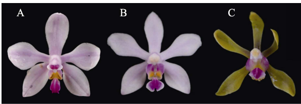
A: 藏南蝴蝶兰; B: 华西蝴蝶兰; C: 红河蝴蝶兰。 A: P. arunachalensis ; B: P. wilsonii ; C: P. honghenensis .