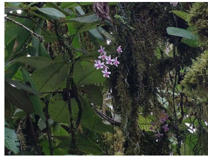
图 1 藏南蝴蝶兰生境

1.5~1.6 cm，宽 0.8 cm，先端钝；侧萼片斜椭圆卵形，长 1.5 cm，宽 0.9 cm，先端钝；花瓣匙型，长 1.5 cm，宽 0.8 cm，先端钝；唇瓣具距，3 裂；侧裂片长圆形，长 9 mm，宽 2 mm，先端斜截形；中裂片长圆形，长 9 mm，宽 4 mm，边缘向下弯曲，先端稍钝而不裂，上面中央具 1 条纵向脊突；距乳头状，长 2 mm；中裂片基部具 1 枚叉状附属物；两侧裂片之间具 1 枚中部呈凹陷状的肉质胼胝体。合蕊柱长 9 mm，具 2~3 mm 蕊柱足。药帽短喙状，紫红色。花粉块 4 个，近球形。