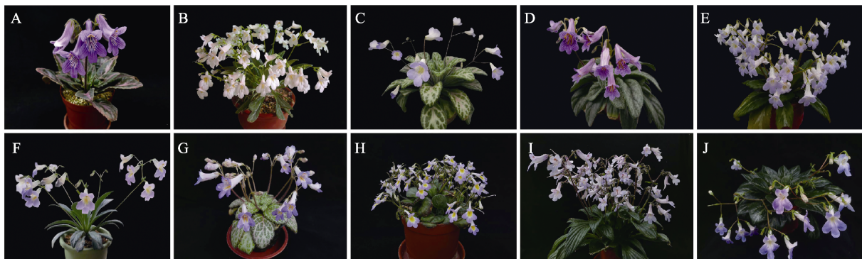
A: 妖后; B: 雪天使; C: 桂中报春苣苔; D: 星尘; E: 覃塘报春苣苔; F: 蓝色心情; G: 柳江报春苣苔; H: 莲座状河池报春苣苔; I: 翔鸟; J: 大根报春苣苔。 A: P. Cleopatra ; B: P. Snow Angel ; C: P. guizhongensis ; D: P. Stardust ; E: P. qintangensis ; F: P. Blue Mood ; G: P. liujiangensis ; H: P. hochiensis var. rosulata ; I: P. Flying Wings ; J: P. macrorrhiza .