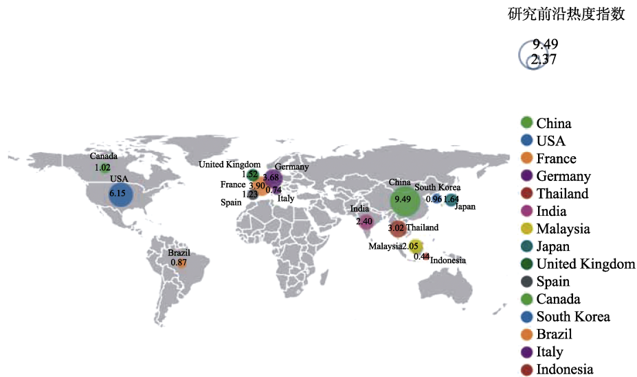
图 2 三大学科领域研究前沿热度指数 Top 15 国家的地理分布