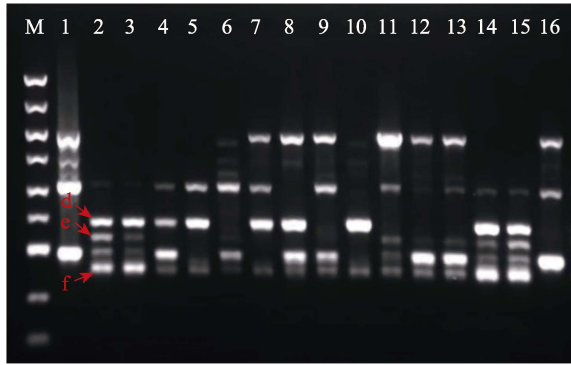
M: DNA marker S plus (100~5000 bp); 1: 亲本菌株 808; 2: 亲本菌株 YX7; 3~16: 杂交菌株 1、2、3、7、13、23、24、31、34、39、42、49、52m 和 56m。 M: DNA marker S plus (100-5000 bp); 1: Parent strain 808; 2: Parent strain YX7; 3~16: Hybrid strains 1, 2, 3, 7, 13, 23, 24, 31, 34, 39, 42, 49, 52m and 56m, respectively.