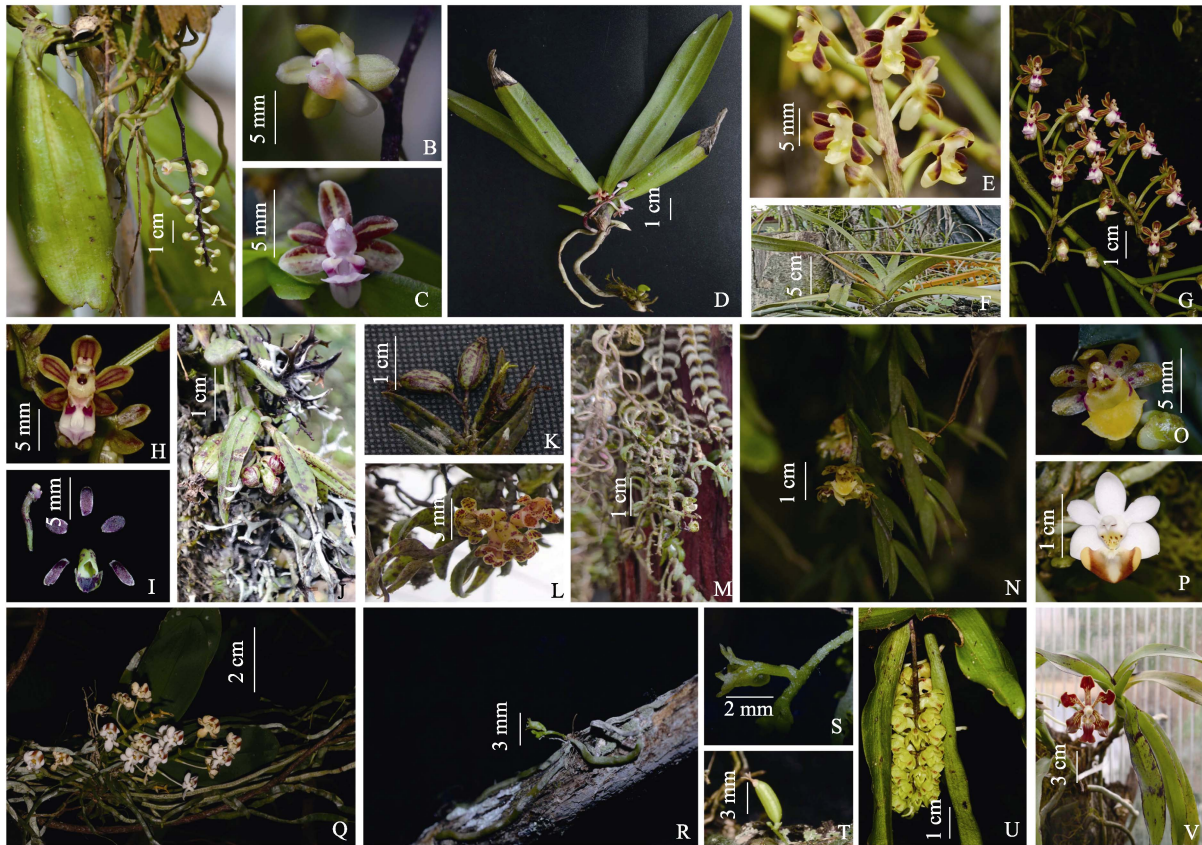
A~B: 二齿叶隔距兰; C~D: 隔距兰; E~F: 大叶隔距兰; G~H: 毛柱隔距兰; I~K: 二脊盆距兰; L~M: 锯叶盆距兰; N~O: 小唇盆距兰; P~Q: 罗氏蝴蝶兰; R~T: 带叶兰; U: 钝叶叉喙兰; V: 琴唇万代兰。

万代兰族植物多数具有重要的观赏价值，如蝴蝶兰属和万代兰属等，此次的发现不仅扩充了西藏兰科植物本底资源，同时也为西藏观赏兰科植物的开发提供基础资料。