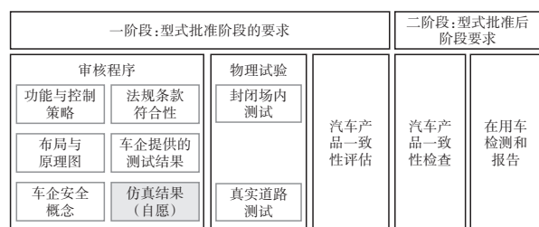
图2 DCAS法规型式批准框架 [11]