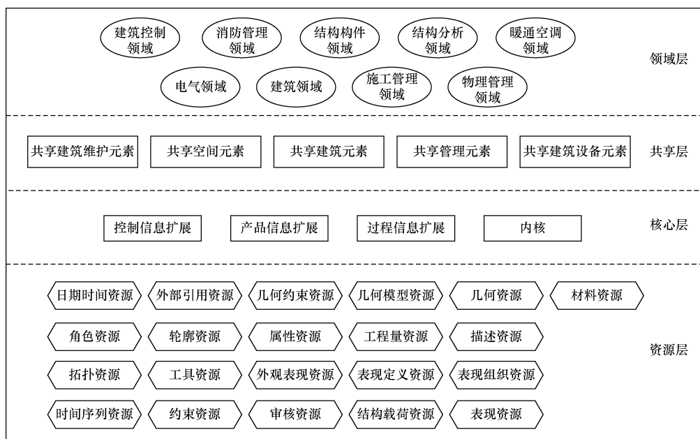
图1 IFC标准整体构架 [21]