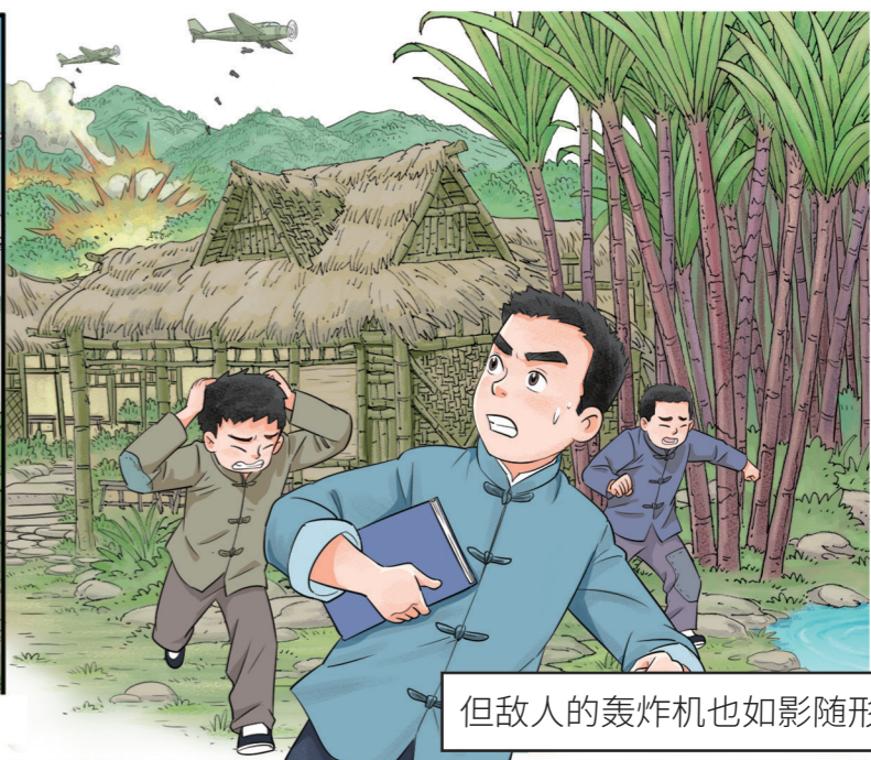
但敌人的轰炸机也如影随形。