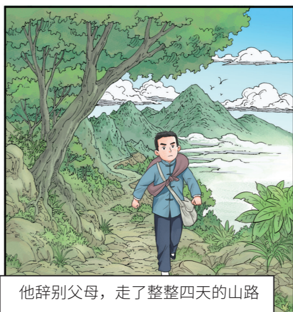
他辞别父母，走了整整四天的山路才找到学校。