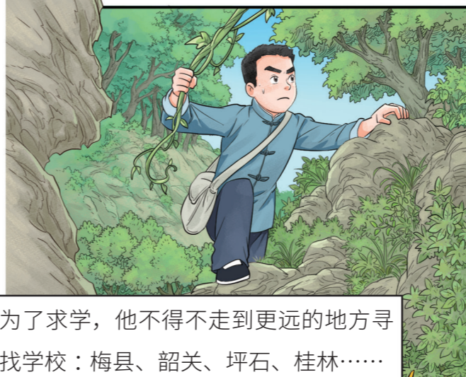
为了求学，他不得不走到更远的地方找学校：梅县、韶关、坪石、桂林……