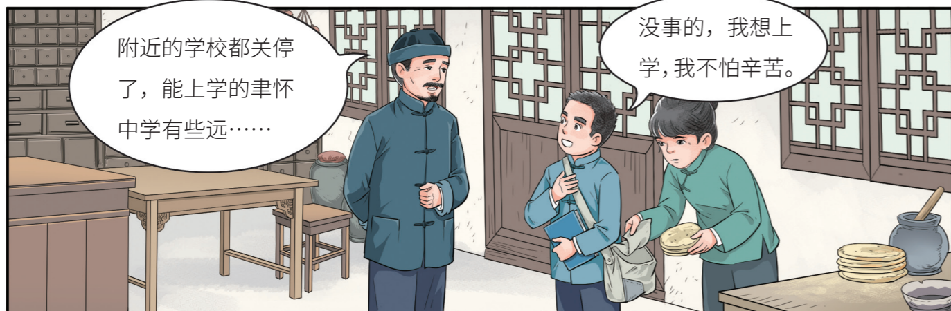
然而，日寇的入侵，打破了他宁静的生活。