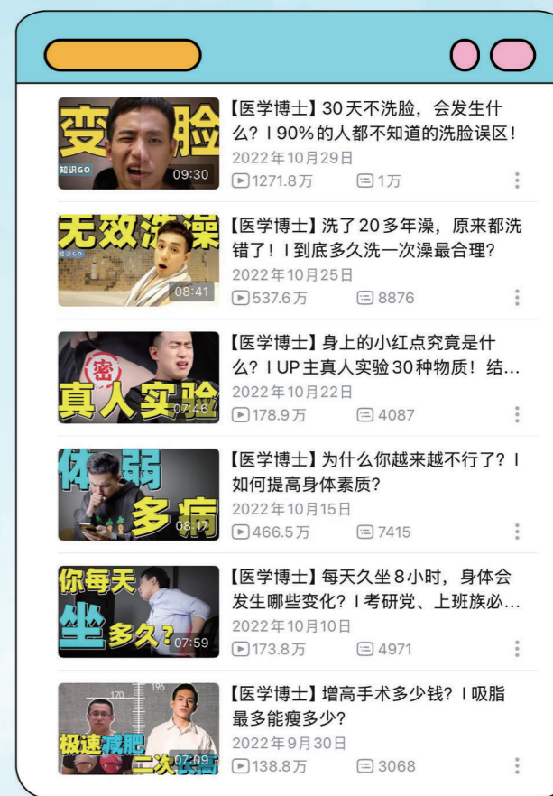
▲“兔叭咯”科普视频（部分）

除此之外，兔叭咯始终坚守一个沟通原则：先换位，再表达。无论是解答疑问还是科普讲解，他都会先尝试理解对方的背景：比如他所从事的工作、日常接触的信息类型以及大致的认知水平。基于这些，他会调整