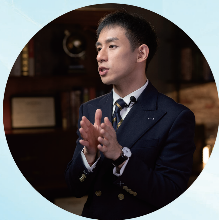
▲“兔叭咯”科普短视频拍摄花絮

那么，如何确保科普内容靠谱呢？即便拥有专业医学背景，兔叭咯也始终坚持一套严格的内容质检机制——“专业支撑+交叉验证”。