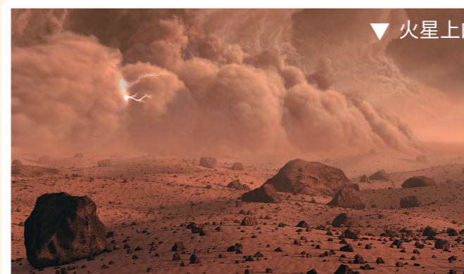
▼ 火星上的沙尘暴想象图

有时候，我“饿”了，就得“吃饭”补充能量。不过，我在火星上只能靠天吃饭。天晴的时候，我能靠太阳能翅膀充电。但一旦遇到沙尘暴，我就得“饿肚子”，一直等到天气转晴。