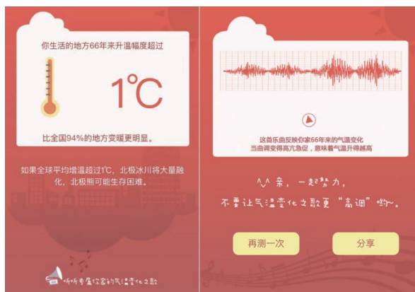
图2 《气候变暖，你家气温升高了几度？》作品截图

化情况。从功能设计来看，每位用户都可以查询全国各地级市的气温变化情况，并收听根据气温变化数据制作而成的音频。这一设计实现了人与机器之间听觉、视觉和触觉的互动。此外，在结果的可视化界面运用第二人称代词“你”与祈使句，建立了召唤机制，拉近了创作者与受众之间的心理距离。这些设计可以缩小社会距离，让受众在参与过程中感受到更强的个体关联与代入感。