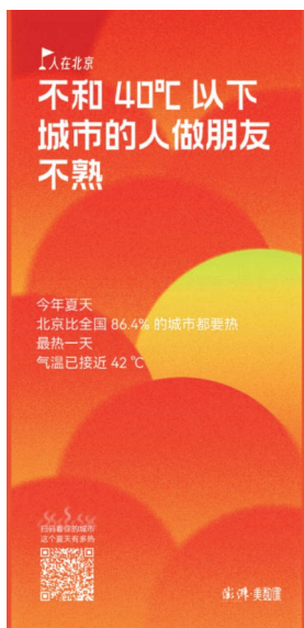
图1 《中国城市气候沸腾榜》海报图

几十种主题海报（见图1），供受众在社交媒体或微信“朋友圈”中进行二次加工与传播，用以叙述炎热夏天的故事。受众二次传播的内容便是基于受众自己认知解读的不同故事。这也可以视为气象科普创作者和受众的创造性协作，双方以不同的视角共同对气象科技资源进行再诠释和再创作，使气象科普呈现更加丰富和立体的面貌。