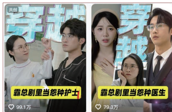
图1 深圳卫健委的医学科普微短剧

2024年4月，深圳卫健委发布了《穿越到霸总短剧里做科普》《穿越到霸总短剧里当护士》（图1）等一系列爆火的医学科普微短剧。“穿