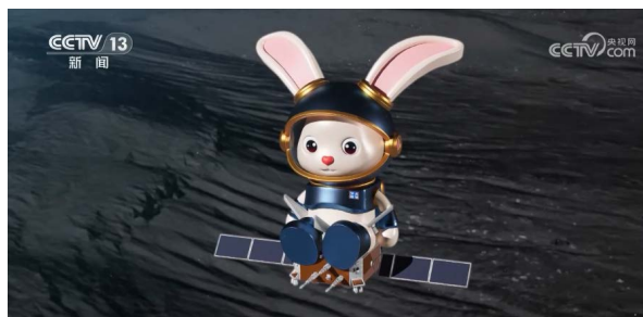
图3《Go“兔”月球》中的空天兔形象

从具体实践层面来看，目前，主流媒体正在集合专业力量，发挥资源优势，积极探索“AI+微短剧”的创作模式。中央广播电视总台联合上海人工智能实验室成立联合攻关团队，于2023年7月共同推出“央视听媒体大模型”。之后，总台联合清华大学新闻与传播学院元宇宙文化实验室，合作探索AI微短剧创作，并于2024年3月推出国内首部AI全流程微短剧《中国神话》。同月，中央广播电视总台还制作了首部AI科普微短剧《Go“兔”月球》（图3），剧中的视觉图像、音乐配乐以及配音均由人工智能创作。在AI技术的辅助下，“空天逐梦”的IP形象“空天兔”作为主角，与主持人一起在虚拟演播室中向观众生动展示了中国探月工程的关键历程。系列作品中，“空天兔”与探月工程四期鹊桥二号中继星、长征八号遥三运载火箭一同从文昌航天发射场出发，踏上前往月球的旅程，深入浅出地科普了“中途轨道修正”“近月制动”等专有名词。