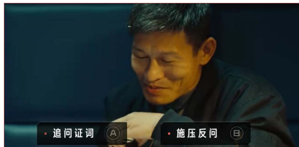
图2 《师傅》的互动选项

目前，一些科普微短剧也借鉴了互动剧的创新模式。竖屏作品如2020年7月“天问一号”发射之际，腾讯微视与中国青年报客户端联合推出的我国首部火星题材互动科普短剧《飞往火星》。观看时，观众可以通过互动选择解锁不同的故事支线，在体验趣味剧情的同时，学习到火星相关知识，以此达到科普的目的。横屏作品如腾讯视频联合中国警察网拍摄的国内首部缉毒题材互动微短剧《师傅》。该剧于2024年2月上线，真实还原了一线缉毒警察的日常工作和奉献精神，同时融入了禁毒宣传与普法教育。该剧制作精良，在每集的关键故事节点上，设计剧情或动作戏选项环节让观众深度参与：剧情选择涉及许多两难抉择（图2），让观众体会到缉毒警真实工作的不易；动作戏互动还融入了第一视角镜头，观众选择执行躲避、打斗、等待、偷袭或转身等多种策略动作时能够获得更高的代入感。在这种兴奋的观剧和游戏过程中，观众能够学到如何辨别第三代新型毒品，了解常见毒品的成分及潜在危害等知识。这种创新的科普形式不仅有助于传播毒品防治的知识，还能通过沉浸式情