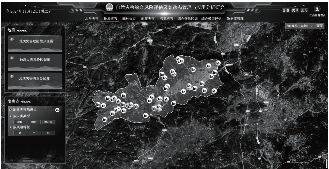
图 6 地质灾害隐患点(部分)展示界面

森林火灾风险评估分为森林火灾危险性、森林火灾风险评估、森林火灾风险区划与防治区划,收集图层包括森林火灾危险性图层、人口风险、经济风险、建筑物风险、森林资源风险、森林火灾风险区划图、森林火灾防治区划图。点击对应的图层展示地图上展示图层详情,图例等,如图 7 所示,部分设置了总体防止区划措施的图层还会显示预防措施,