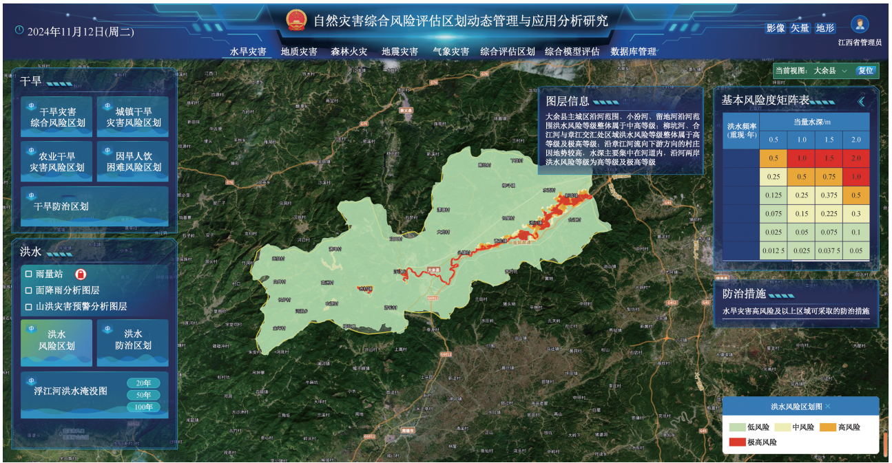
图 3 洪水灾害风险评估区划研究成果展示界面

性、农作物风险、GDP 风险、人口风险图层。点击图层板块可以查看对应图层,如图 4 所示;点击对应的图层展示地图上展示图层详情,图例等,部分设置了总体防止区划措施的图层还会显示预防措施;点击单条预防措施可以展开预防措施详情,查看全部内容。