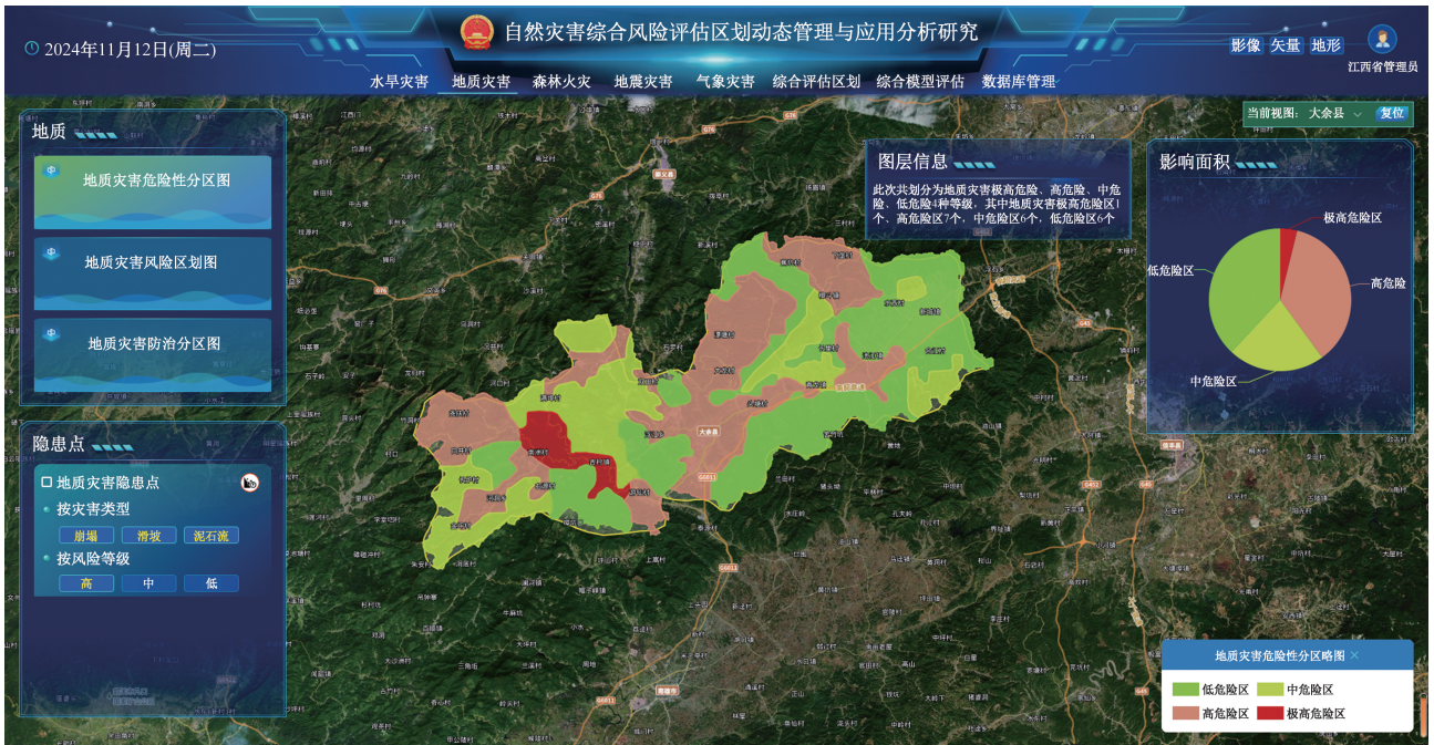
图 5 地质灾害风险评估区划研究成果展示界面