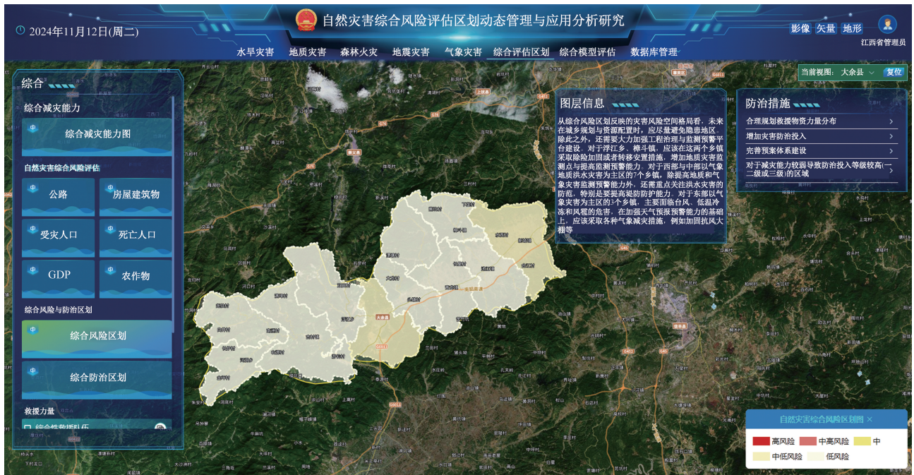
图 9 综合风险评估区划研究成果展示界面

通过对气象灾害的 9 大灾种的致灾危险性评估结果的提取及权重的设置,综合分析得到气象灾害综合致灾危险性评估结果。具体模型界面如图 10 所示。