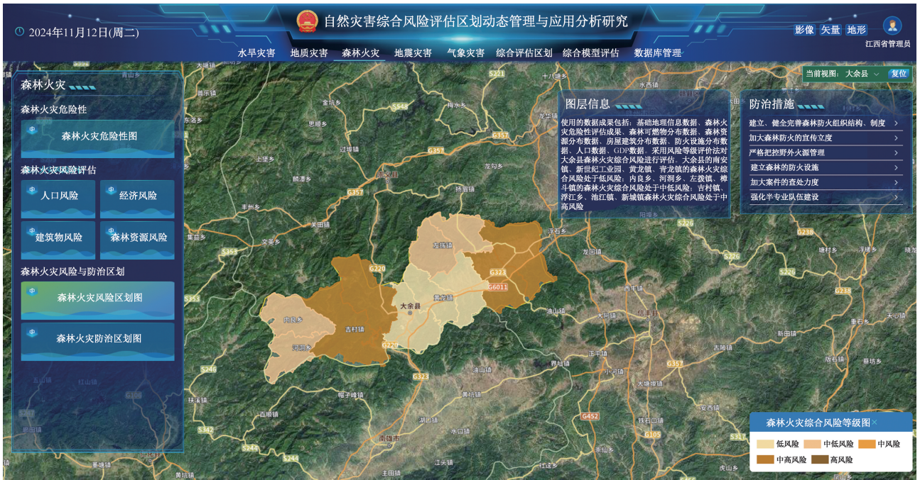
图 7 森林火灾风险评估区划研究成果展示界面