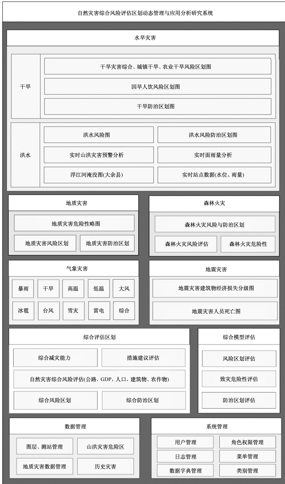
图 1 系统功能模块

加健壮的使用现有的 spring 功能。访问 https://spring.io/projects 页面,可以看到在应用程序中使