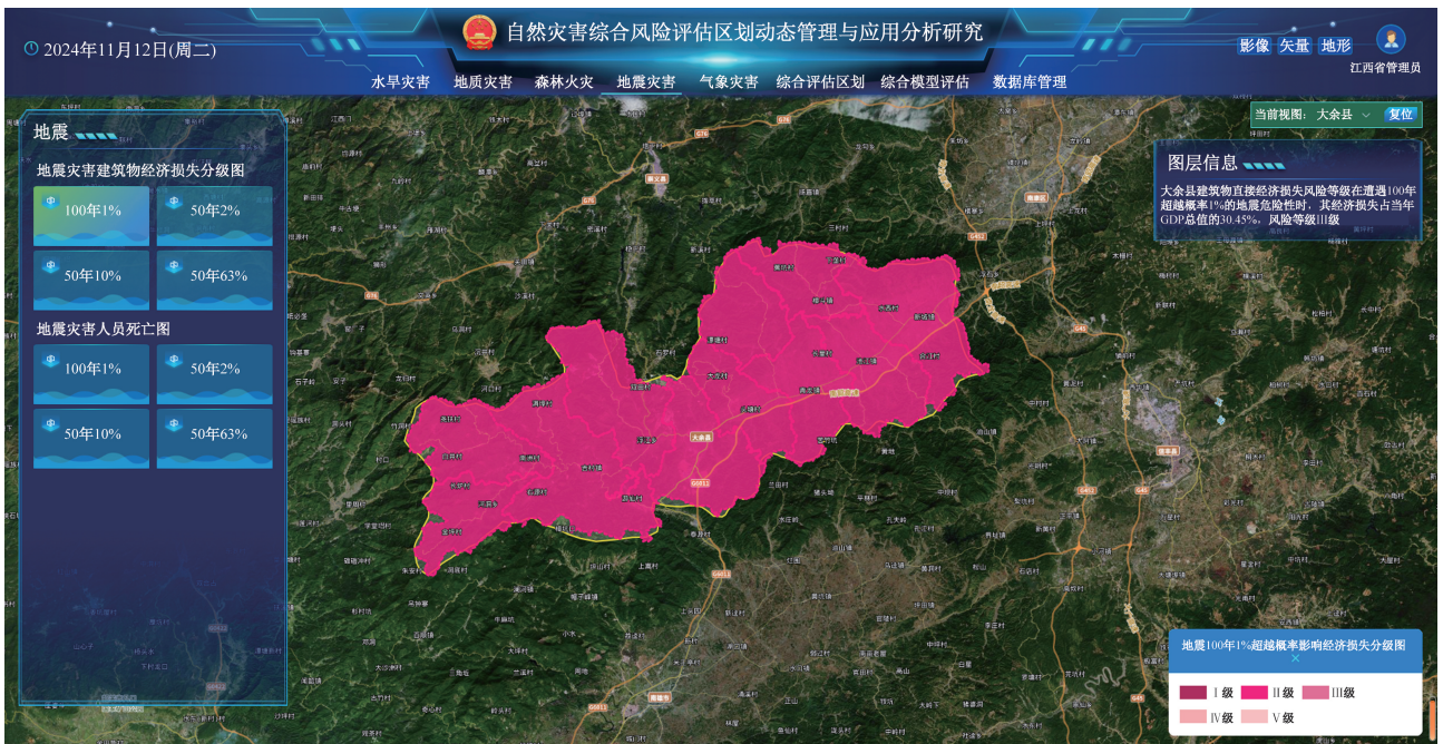
图 8 地震灾害风险评估区划研究成果展示界面

结合 5 大灾害, 收集综合性评估区划结果图层, 包括综合减灾能力, 自然灾害综合风险评估、综合风险与防治区划, 收集图层包括综合减灾能力图、公路风险评估、房屋建筑物评估、受灾人口评估、死亡人口评估、GDP 风险评估、农作物风险评估、综合风险评估区划、综合风险防治区划。点击对应的图