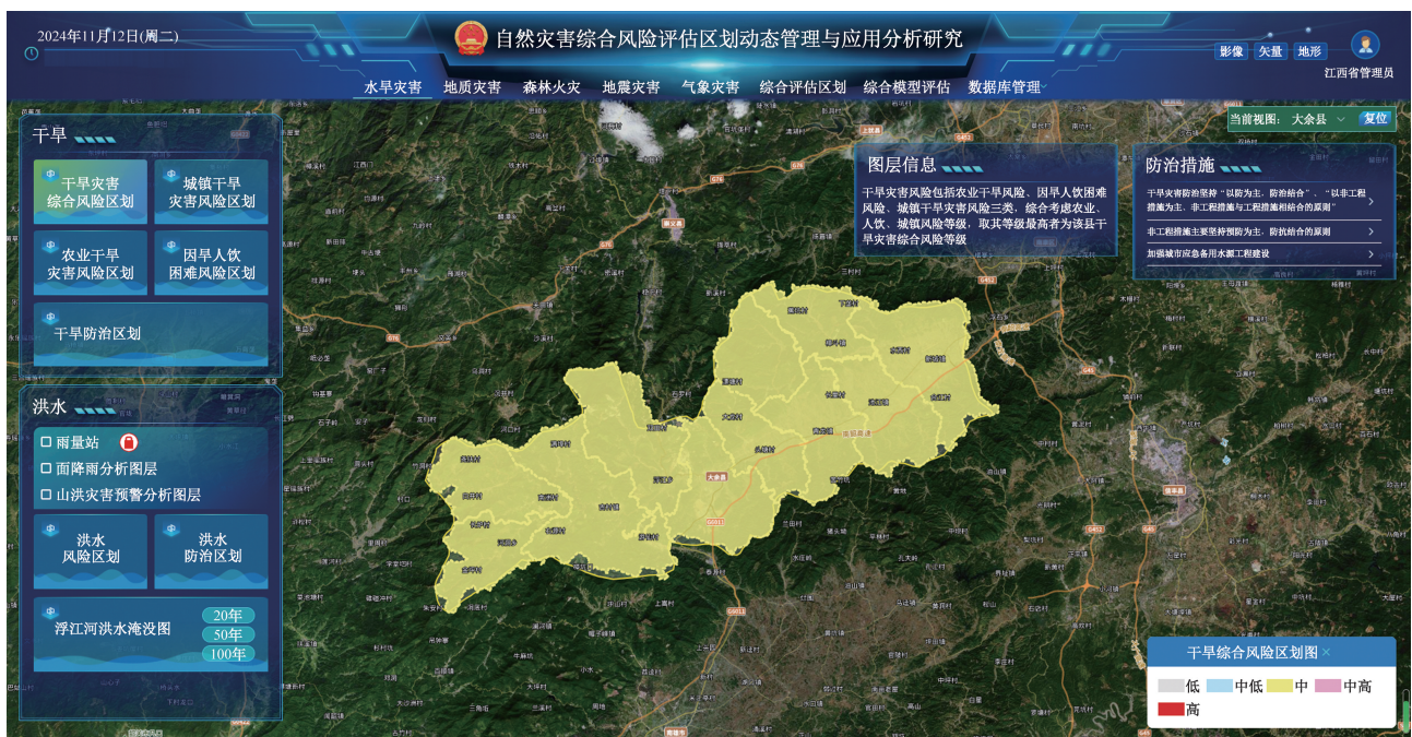
图 2 干旱灾害风险评估区划研究成果展示界面

气象灾害风险评估分为 9 种气象灾种图层,分别是暴雨、干旱、高温、低温、大风、冰雹、台风、雪灾、雷电。每个灾种分为 4 种图层,分别是致灾危险