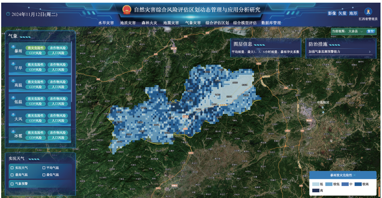
图 4 气象灾害风险评估区划研究成果展示界面

(1)地质灾害。展示地质灾害评估区划成果分别为地质灾害危险性分区略图、地质灾害风险区划略图、地质灾害防治分区略图。点击对应板块展示对应图层,如图 5 所示;同步展示地质灾害各个风险区影响面积统计图;点击对应的图层展示地图上展示图层详情,图例等,部分设置了总体防止区划措施的图层还会显示预防措施;点击单条预防措施可以展开预防措施详情,查看全部内容;点击地图板