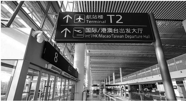
图3 运城盐湖机场国际/港澳台出发大厅

各部门的骨干技术人员组成项目组,加强执行国际航班的保障任务,深化研究各种专项保障措施,为安全高效的保障奠定了基础。鉴于运城盐湖国际机场的国际航运业务尚处于开航的初期阶段,与该业务相关的人员配备、岗位设置以及管理措施等仍在完善提高。所以,对机场运行进行风险评估,提前发现机场运行中的风险和隐患,就显得尤为重要和迫切。首先,对机场运行生产一线工作人员进行访谈,并给各指标进行百分制打分,得到其对各级指标的评价分数情况,见表5。