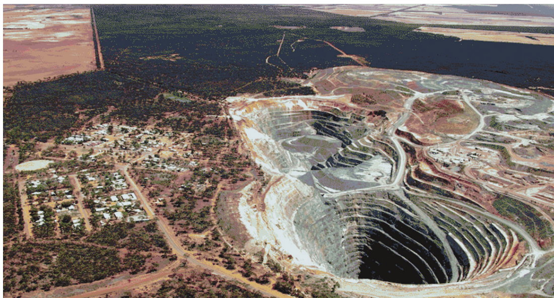
澳大利亚的锂矿开采

年,全球锂产量的74%集中于澳大利亚、智利与中国三国。消除高温窑炉需求可降低对大型设施的依赖,减少管理化石燃料燃烧的现场基础设施成本。此外,闭环系统几乎不产生废物,可消除对大型废物处理厂的需求,使小型锂精炼厂成为可能。由于锂辉石矿石锂含量低,跨洋运输的材料中90%以上为废石。小型化生产可使硬岩精炼靠近矿山进行,大幅降低运输成本。此外,低温操作允许更灵活的动态调温,相比传统高温窑炉工艺(需漫长且高能耗的启动周期才能达到操作温度),更易与可再生能源(如太阳能与风能)整合。由于主要锂硬岩矿区的地理位置与丰富的太阳能及风能资源重叠(如西澳大利亚与中非),这一特点尤为有利。