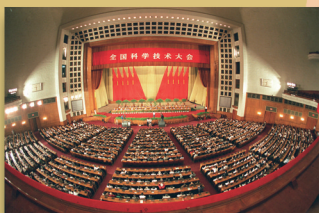
1995年5月，全国科学技术大会在北京召开

坚持实施科教兴国战略，大力推进科技创新，努力为我国先进生产力和先进文化的发展，为维护 and 实现我国最广大人民的根本利益不断贡献智慧和力量。