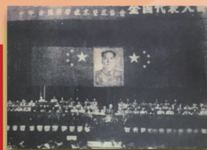
1958年9月，全国科联和全国科普全国代表大会联合在北京召开