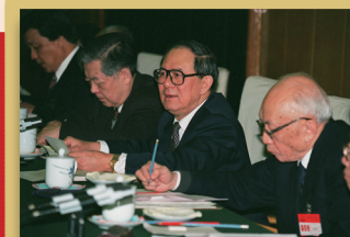
1996年2月7—9日，全国科普工作会议在北京召开