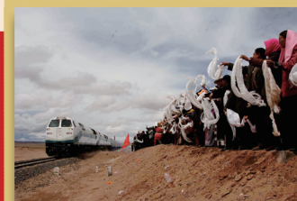
2006年7月1日，青藏铁路全线建成通车