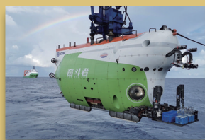
2020年11月28日，“奋斗者”号全海深载人潜水器成功完成万米海试并胜利返航

在我国发展新的历史起点上，把科技创新摆在更加重要位置，吹响建设世界科技强国的号角。