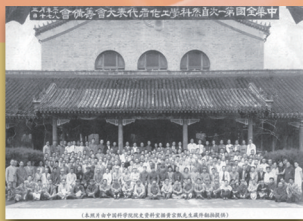
1949年7月13日，科代会筹备会议在北京召开

科学技术这一仗，一定要打，而且必须打好。现在生产关系是改变了，就要提高生产力。不搞科学技术，生产力无法提高。