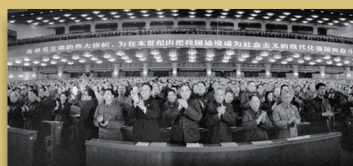
1978年3月18—31日，全国科学大会在北京隆重召开

马克思说过，科学技术是生产力，事实证明这话讲得很对。依我看，科学技术是第一生产力。