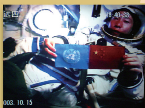
2003年10月15日，中国发射“神舟五号”载人飞船