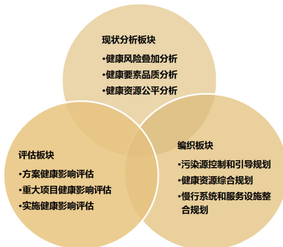
健康城市规划工作流程