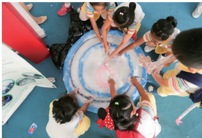
图1 全国科普日北京主场活动