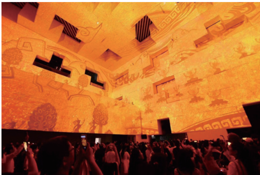
图2 中国科技馆科学之夜