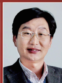
孙立成 Licheng Sun