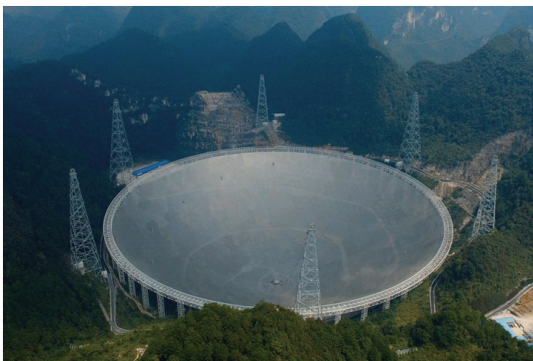
图 1 利用喀斯特地貌在群山之中建成的 FAST 射电望远镜 Fig. 1 The photo of the FAST built in the Karst depression

中国 FAST 射电望远镜定位为工作在低频的一台超大型射电望远镜,其工作频率覆盖范围为 70 MHz~3 GHz。为突破射电望远镜的百米口径工程极限同时大幅度降低工程造价,无论在设计理念还是工程概念上,FAST 都进行了大胆创新。它利用贵州天然喀斯特洼坑作为台址,由 4450 块可调节反射面板构成 500 m 口径球冠主动反射面,其指向跟踪及定位则采用轻型索拖动机构和并联机器人实现(图 1 [7]) 。与美国阿雷西博 305 m 望远镜相比,FAST 将多覆盖 2~3 倍的天区,灵敏度也提高 2.25 倍左右 [8-9] 。综合考虑 FAST 望远镜的工作频段、观测灵敏度及脉冲星辐射特性,可以得出 FAST 将成为脉冲星观测研究利器这一毫无争议的结论。