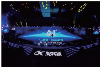
科大讯飞2016年度发布会现场

11月23日,科大讯飞2016年度发布会在北京召开。围绕2016年以来在人工智能(AI)领域的研发进展,科大讯飞推出数款新产品,涉及输入法、语音翻译、电视、汽车和机器人等领域。中国工程院院士、中国人工智能学会理事长李德毅、中国移动通信集团公司副总裁李正茂、IBM大中华区首席技术官沈晓卫等出席了发布会。