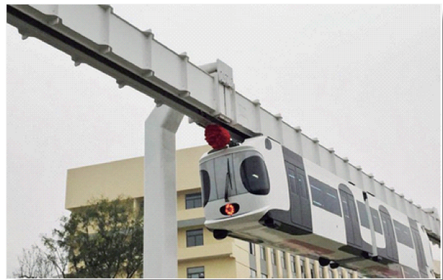
世界首条新能源空铁试验线

11月21日,世界首条新能源悬挂式空中轨道交通试验线顺利贯通,这是中国首创的技术领先、经济适用的一种新型城市轨道交通制式。