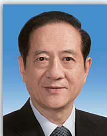
韩启德 十二届全国政协副主席 中国科学技术协会名誉主席