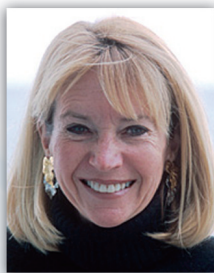
Marcia McNutt 美国科学院院长