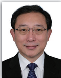
曹雪涛 中国医学科学院院长 中国科协生命科学学会 联合体主席团成员 中国工程院院士