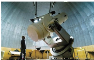
紫金山天文台盱眙观测站的科研人员在观测前检查近地天体望远镜运行状态

9月7日,一颗对地球具有潜在威胁的近地小行星2009ES掠过近地点。借助有着亚洲最大“地球哨兵”之称的1.2米口径近地天体望远镜,中国科学院紫金山天文台研究人员在盱眙观测基地首次观测到小行星2009ES。而9月2日和7日晚,另外2颗近地小行星在地球和月球之间呼啸而过,从天文学角度来看,它们与地球距离仅有“一根头发”。