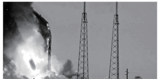
“猎鹰9”号火箭爆炸瞬间

9月1日,美国太空探索技术公司(SpaceX)的“猎鹰9”号火箭在佛罗里达州卡纳维拉尔角发射场的一次常规测试中发生爆炸,