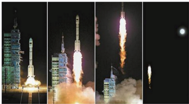
天宫二号发射升空

9月15日,中国在酒泉卫星发射中心用长征二号F T2火箭将天宫二号空间实验室发射升空。这是中国载人航天工程实施以来长征二号F运载火箭的第12次飞行。