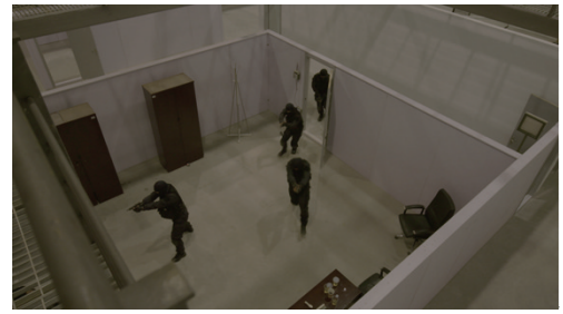
图8 响应力量训练及演练设施——非实弹战术训练区