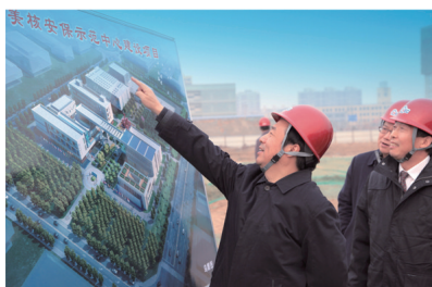
图1 国家原子能机构主任许达哲视察COE项目现场

5) 模拟核材料库。用以展示核材料库配备的各种探测、延迟设备(图9),开展延迟技术和方法学的培训、演示。