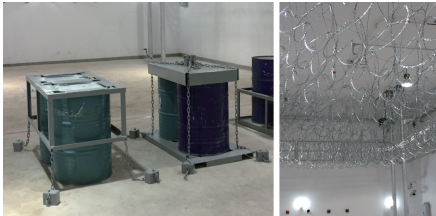
图9 模拟核材料库——延迟设备展示