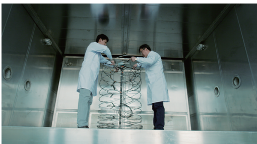
图4 环境试验室步入式温湿试验箱