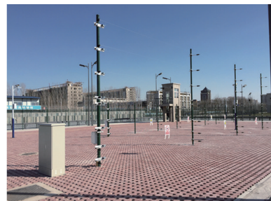
图6 实物保护室外测试场