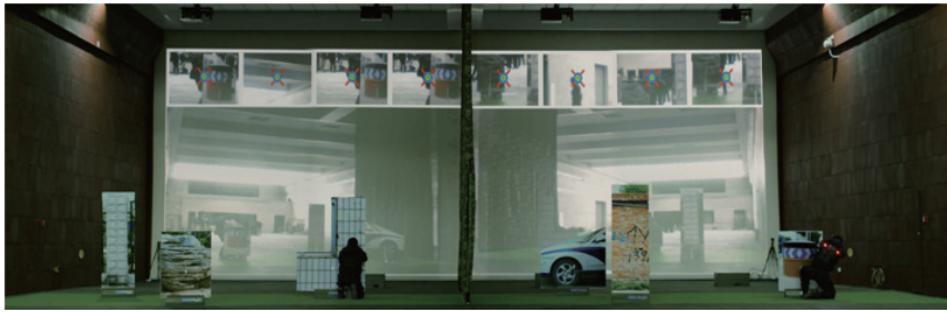
图7 响应力量训练及演练设施——实弹射击区