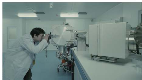
图3 分析实验室热电离质谱仪