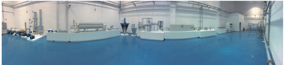
图10 核材料衡算与控制综合培训设施

6) 核材料衡算与控制综合培训设施(图10)。核材料衡算与控制综合培训设施示范了在真实核设施里所进行的核材料工艺流程,例如模拟核燃料生产厂的工艺流程,用以开展核材料衡算与控制技术的培训和方法研究。