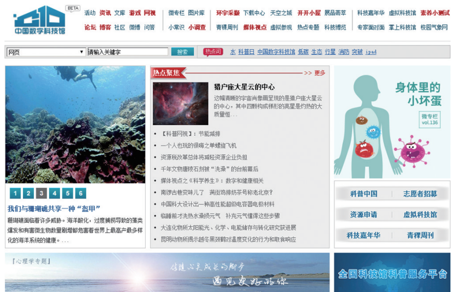
图2 中国数字科技馆网站

在项目推进的同时,秉持开源、众创、分享的理念,实施“互联网+科普”行动计划,努力推动形成开放协作的科