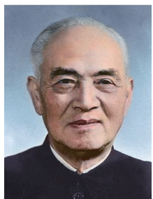
中国科协第一届 主席 李四光