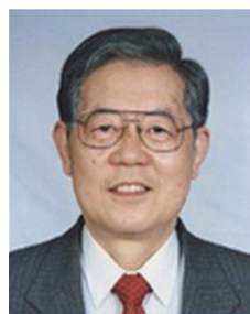
中国科协第五、六届 主席 周光召