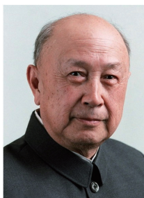
中国科协第三届 主席 钱学森