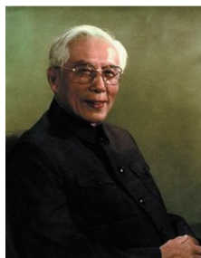
中国科协第二届 主席 周培源