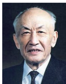
中国科协第四届 主席 朱光亚