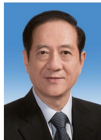
中国科协第七、八届 主席 韩启德

手作用,在协助党和政府落实知识分子政策,弘扬“尊重知识、尊重人才”的风尚中发挥纽带作用,开创了科协工作新局面。