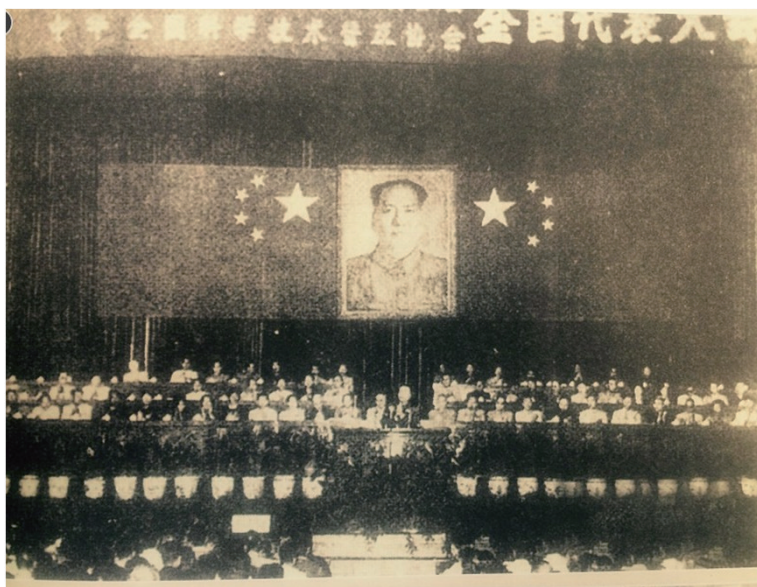
中国科协“一大”

在邓小平同志的亲切关怀下,1978年3月18日,全国科学大会召开。邓小平同志在开幕式上作了具有历史意义的重要讲话,被誉为“科学的春天”到来。当时主管科教工作的国务院副总理方毅也在这次大会上作了《向科学技术现代化进军》的动员报告。在“科学的春天”里,中国科协的组织活动得到迅速恢复与发展。1980年和1986年科协“二大”、“三大”顺利召开,中国科协紧紧围绕以经济建设为中心,团结带领广大科技工作者深入开展学术交流、科学普及和咨询服务等工作,积极贯彻“经济建设必须依靠科学技术,科学技术工作必须面向经济建设”方针,发挥党和政府的参谋助