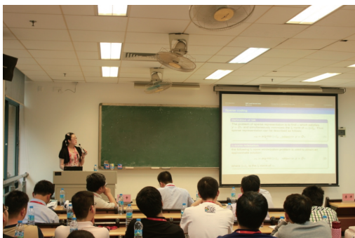
图5 博士生代表做口头报告