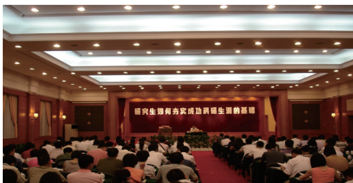
图3 中国科协副主席冯长根做大会特邀报告