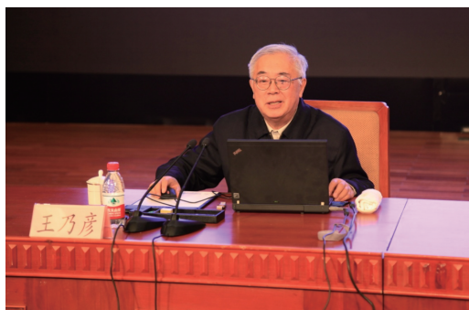
图2 中国科学院院士王乃彦做大会特邀报告