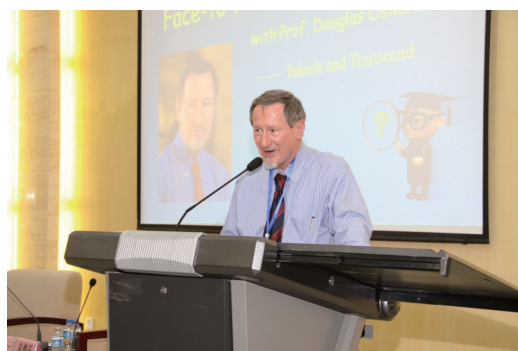
图7 诺贝尔奖获得者道格拉斯·奥谢罗夫与博士生面对面

奥谢罗夫、厄温·内尔,图灵奖获得者姚期智3位科学大师分别在云南大学、昆明医科大学和昆明理工大学举办了3场“科学大师与博士生面对面”活动,采用英语交流互动,博士生就学科发展、科学研究、个人成长等感兴趣的问题向大师提问(图7)。2015年,年会组织200余名博士生积极参与中国科协年会期间举办的国际科学大师论坛,听取诺贝尔奖获得者阿夫拉姆·赫什科、根岸英一、丹·舍特曼,狄拉克奖获得者爱德华·布列桑,图灵奖获得者温顿·瑟夫5位国际科学大师的主旨演讲。