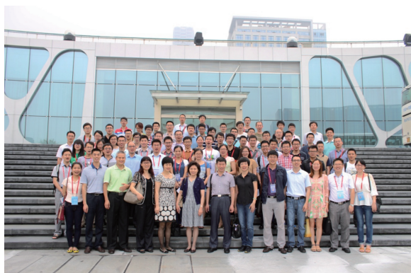
图1 博士生年会中博士生代表参观科技城