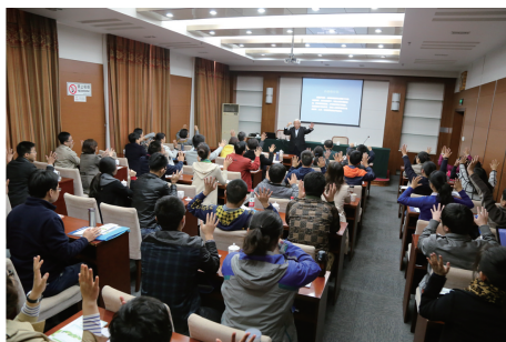
图5 2015年10月全国核科普讲师培训班

核技术应用、核军工、核燃料、快堆核电6个科普传播专家团队。李冠兴介绍,中国核学会的科普专家团队共有7名院士和20名资深专家组成。为提高科普宣讲队伍的业务水平,打造一支覆盖全国的专业核科普工作者队伍,中国核学会举办“全国核科普讲师培训班”(图5),为40余家团体会员及地方政府的科普骨干进行了培训并颁发结业证书。