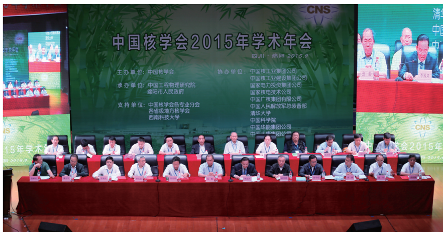
图1 中国核学会2015年学术年会