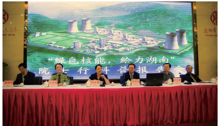
图8 2013年5月“绿色核能、给力湖南”院士行科普活动

学、核医学、核安全保障、核技术应用等环境保护热点领域1840条重点词条,上传到百度百科,充分发挥网络科普的作用,提高科普效果和社会影响力。