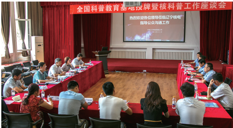
图3 2015年全国科普教育基地授牌仪式暨核科普工作座谈会