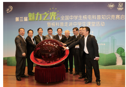
图6 第三届“魅力之光”杯全国中学生核电科普知识竞赛启动仪式

核科普作品的创作与出版,是科普工作有效传播的途径之一。李冠兴表示,中国核学会致力于编制通俗易懂的科普图书和资料,广泛吸引阅读兴趣,提高受众的科技素质。学会编著的科普读物《走近核科学技术》、《“核”我探秘——我们身边的核科学技术》(图9)、《走近核科学技术》2010年荣获中国科普作家协会优秀科普作品奖。同时承担了中国科协“科普中国百科科学词条编写与应用工作项目”,编写核能发电、核燃料循环、核辐射与防护、核农