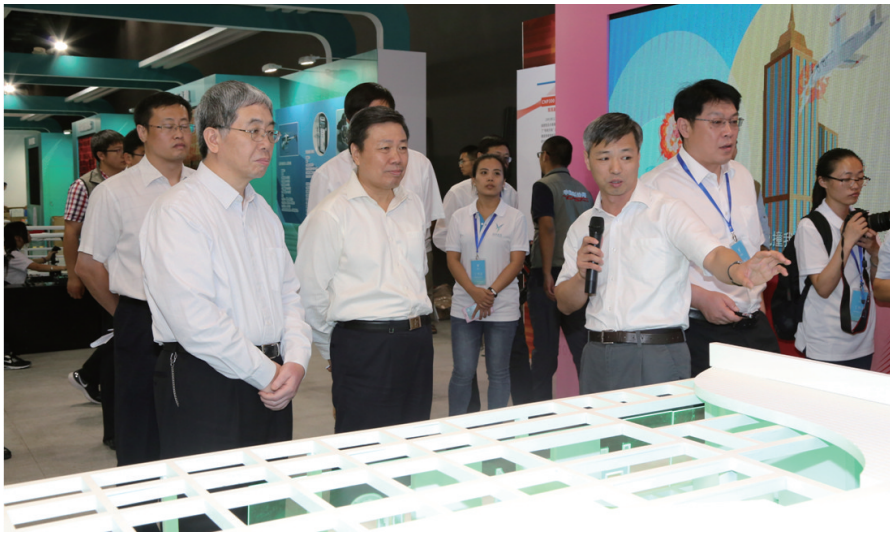
图2 中国科协党组书记、常务副主席、书记处第一书记尚勇2015年全国科普日参观“华龙一号”展区