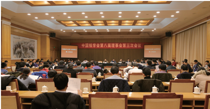
图10 中国核学会第八届理事会第三次会议

革工作的全面开展,中国核学会应牢牢把握服务广大科技工作者、服务创新驱动发展战略、服务公民科学素质提高、服务党委政府科学决策,加强自身建设的“四服务一加强”工作新定位,切实克服机关化、行政化倾向。建载体、搭平台、创新体制机制,不断增强学会会员凝聚力、学术公信力和 社会影响力,把学会建设成为充满生机和活力的现代科技社团。李冠兴表示,当前要立足中国核工业快速发展的良好时机,紧紧抓住学会能力提升和政府职能转移的有利时机,盯住“向国际一流学会迈进”的目标,统一认识、主动作为、开拓创新、做好顶层设计,加强内部管理,积极开展工作,调动分会和会员两个积极性,努力将学会工作推向新的台阶,在推动核科技创新、核产业发展中发挥更大作用,做出更大贡献。