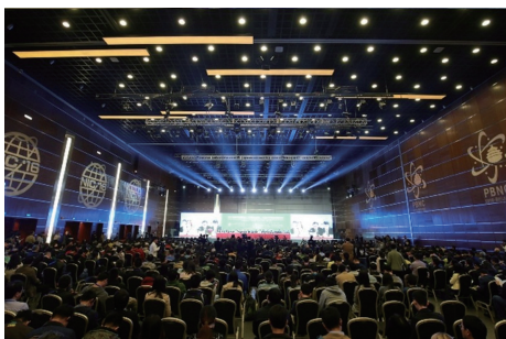
图4 2016年第十四届中国国际核工业展览会暨第二十届太平洋地区核能大会

科普人才队伍建设,提升科普公共服务能力,中国核学会加强核科普专家团队建设和骨干培训,建立了核安全、核电、