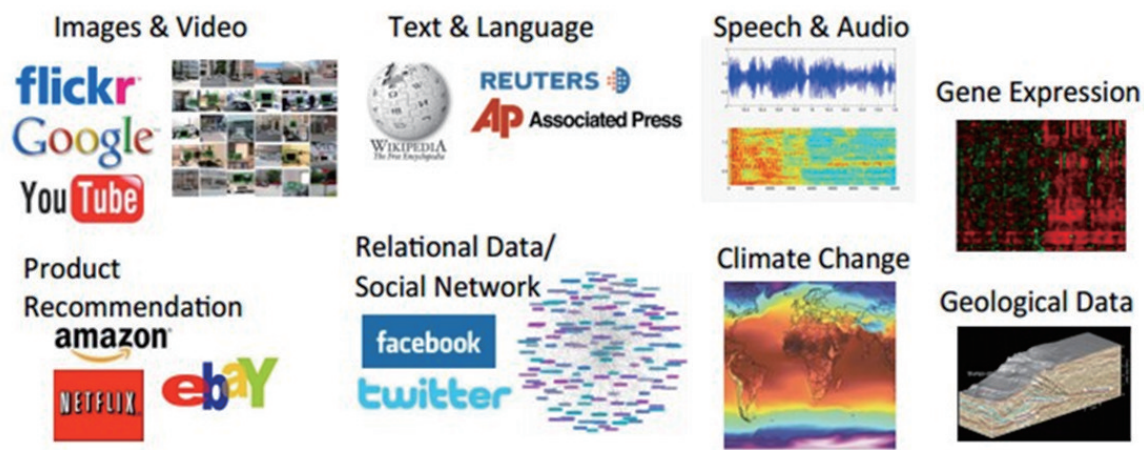
图 1 深度学习的应用领域

深度学习是一种机器学习中建模数据的隐含分布的多层表达的算法 (图 2)。换句话说, 深度学习算法自动提取分类中所需要的低层次或者高层次特征。因此深度学习能够更好地表示数据的特征, 同时由于模型的层次、参