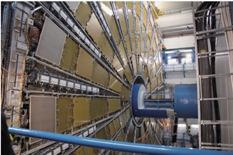
欧洲大型强子对撞机 LHC

则这种暗物质和夸克或胶子有一定的相互作用,从而 Tevatron 或 LHC 这样的质子对撞机就可以产生出来这种暗物质。同样的,这种暗物质也可以湮灭产生出夸克,从而给出间接探测信号。3种暗物质探测方式各有自己的优势和劣势,结合不同探测手段以得到一个统一的暗物质图像。