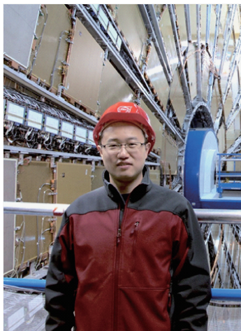
周宁在 LHC 实验现场

对于希格斯粒子, 周宁说它是粒子物理标准模型中存在的一个粒子, 其于 2012 年在欧洲核子中心的 ATLAS 和 CMS 实验中被发现。至此, 标准模型中所有粒子都已经发现。目前, 周宁表示, 不断提高测量精度乃至计划建造新的对撞机去检验希格斯粒子的物理性质, 因为自然界的希格斯粒子有可能和超出标准模型的新物理相关联, 从而导致其性质和标准模型的预言有所差异。比如, 希格斯粒子有可能和暗物质这个超出标准模型的粒子存在耦合, 从而作为暗物质和可见物质联系的纽带, 这样就会导致希格斯粒子不可见衰变的分支比发生变化。周宁与其研究团队在 LHC 一期数据分析中系统性的测量了希格斯粒子的性质, 他在 ATLAS 实验上通过 W 玻色子和希格斯粒子共同产生的过程去进行不可见衰变测