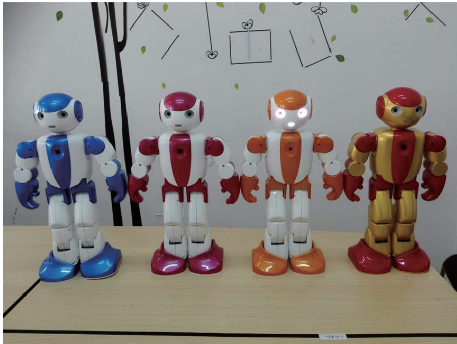
图1 英语伴读小博士机器人

从家长的角度来看,儿童陪护机器人最核心的价值是促进儿童的健康成长,替代甚至是超越家长的部分教育角色。究其原因,主要在于绝大多数家长并非全职在家,没太多时间陪