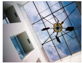
学会的门廊中悬挂着阿里尔一号的工程模型。这是国际合作下发射的首颗人造卫星。

英国皇家学会起到了英国国家科学院的作用,其核心是学会团体和国外会员,由在伦敦和其他各地的专职职员为其提供服务。学会团体是由英国、爱尔兰和英联邦中最杰出的科学家组成。学会的主要活动是寻找和支持杰出科学家的工作,同时为科学组织提供服务,皇家学会通过组织计划和科研项目对科研机构、个人、访问学者、奖学金人员及学术会议、出版物、学术报告活动等进行资助。学会通过组织讨论会议,加强科学家之间的交流互动,通过期刊发布科学研究进展,还从事研究团体以外的活动,就科学问题向英国政府提供独立有效的咨询、对高质量科学教育进行促进、与公众建立交流沟通。