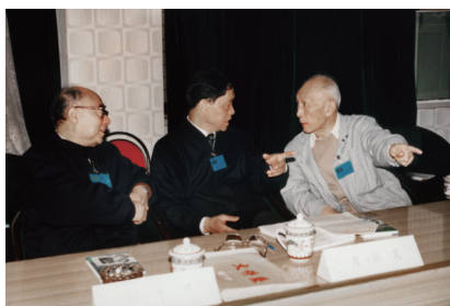
图5 1987年4月,朱光亚与陈能宽(中)、于敏(左)讨论问题

主张充分的学术民主,在做决策时,他会组织大家进行广泛而深入的讨论,鼓励不同的意见与观点的碰撞(图5)。他会耐心地倾听各方意见,无论是正面还是反面意见,都给予充分的尊重与考量,甚至鼓励大家进行辩论。朱明远提及中国科学院院士贺贤士的一段难忘经历:贺院士曾经与朱光亚一起开会,他们从傍晚七八点开始,一直讨论到凌晨三四点。朱光亚鼓励大家自由发表观点,在综合各方意见后,会结合自身经验和判断,最终做出决策。这种民主的氛围,不仅能够最大程度地集思广益,避免了决策的片面与主观,也能够让资深科学家们感受到足够的尊重与重视。